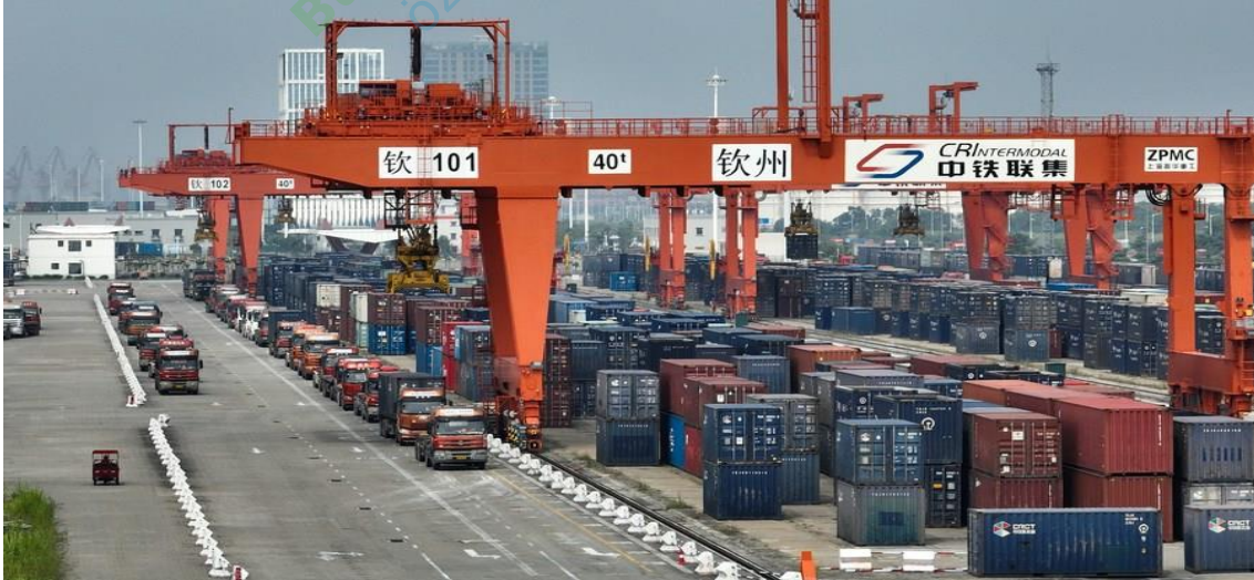
Kaynak: Zhang Ailin

China Everbright Bank analisti, Çin dış ticaretinin gelişmiş bir yapı ve kayda değer bir esneklik gösterdiğini belirterek, önümüzdeki birkaç ayın yabancı ülkelerde yoğun alışveriş sezonuna denk gelmesi nedeniyle Çin ihracatının güçleneceğini düşünmektedir. Ticaret Bakanlığı sözcüsü, "Dördüncü çeyrekteki iyi ivmeyi daha da sağlamlaştırmak, dış ticaret kalitesini istikrara kavuşturmak ve iyileştirmek için yıllık hedeflere ulaşma konusunda kendimize güveniyoruz" demiştir.