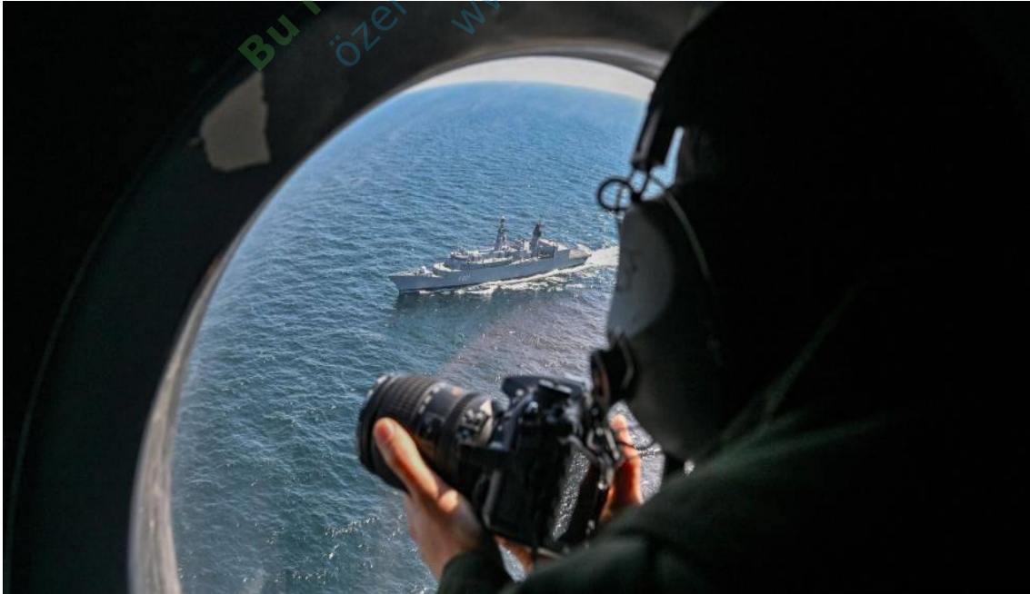
Kaynak: Daniel Mihai

Karadeniz'deki jeopolitik rekabet, bölgesel düzenin temelini yeniden şekillendirmektedir. Rusya'nın Karadeniz'deki artan etkisi, Ukrayna'ya yönelik politikaları ve komşu bölgelere yönelik nüfuz girişimleri, bölgenin güvenliğini ciddi şekilde tehdit etmektedir. Bu durum, Avrupa'nın güvenliğine yönelik büyük bir meydan okuma olarak ortaya çıkmaktadır.