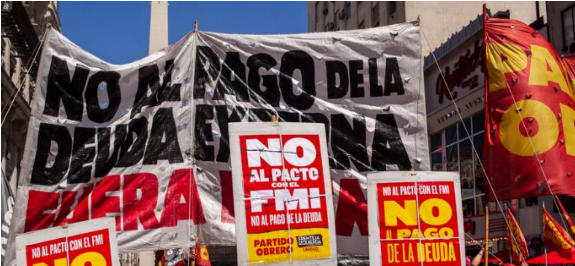
Kaynak: Ricardo Ceppi

IMF, küresel finansal sistemin istikrarı için kritik bir kurum olmaya devam etse de meşruiyetini korumak için reformlara ihtiyaç duymaktadır. Özellikle iklim krizi, artan borç yükü ve gelişmekte olan ülkelerin temsil sorunları, fonun gelecekteki etkinliğini belirleyecek başlıca unsurlardandır.