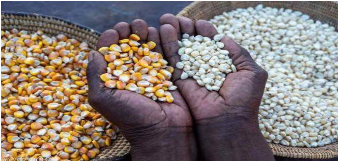
Kaynak: Michael Major

Güney Afrika, Güney Afrika bölgesinin ana mısır üreticisi olup bölgedeki toplam üretimin yaklaşık %70'ini tek başına sağlamaktadır. ABD Tarım Bakanlığı, ülkenin 2023/24 yılları arası mısır üretiminin bir önceki yıla göre %15 oranında azalarak 14,5 milyon metrik ton olacağını tahmin etmektedir. Güney Afrika'daki devam eden kuraklık , bölgedeki gıda güvenliği ve tarımsal üretim için önemli zorluklar oluşturmayı sürdürmektedir.